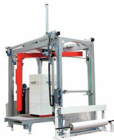
SILVER GO - TS

Diese automatische Dreharmmaschine ist nach dem Baukastenprinzip entworfen und daher sehr flexibel. Dank dieser Modularität und der Einfachheit der Einstellungen ist diese Maschine vielfältig und zudem garantiert der neue Deckblattaufleger nicht nur eine perfekte Abdichtung sondern auch einen schnelleren Folienwechsel.